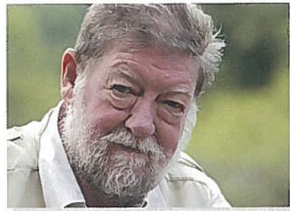
C.W.ニコル C.W. Nicol 作家・ナチュラリスト