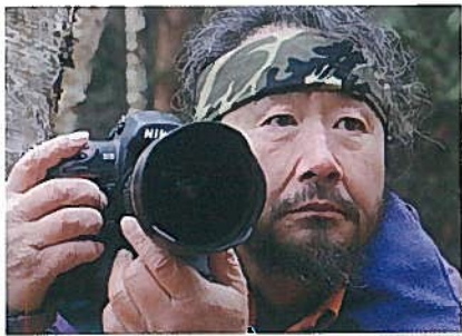
宮崎 学 Manabu Miyazaki 動物写真家