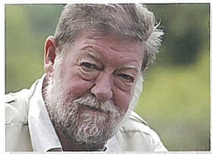
C.W.ニコル C.W. Nicol 作家・ナチュラリスト